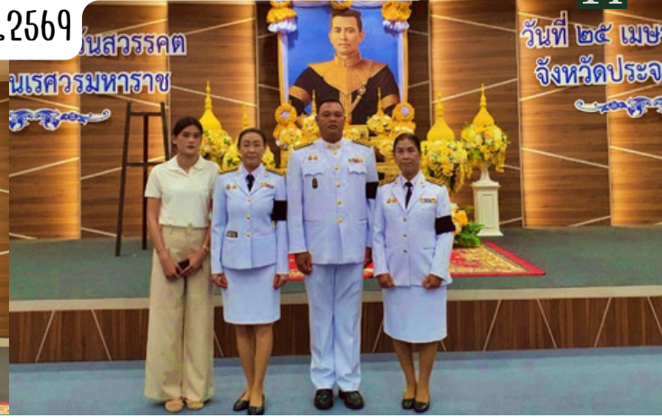
ข้าราชการ พนักงานเทศบาล ร่วมพิธีวางพวงมาลาเนื่องในวันคล้ายวันสวรรคต "สมเด็จพระนเรศวรมหาราช" ประจำปี พ.ศ.2569 ณ ห้องพิธีการ ชั้น 5 ศาลากลางจังหวัดประจวบคีรีขันธ์ (วันที่ 25 เมษายน 2569)