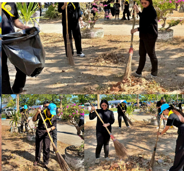
ข้าราชการ พนักงานเทศบาล ร่วมกิจกรรมจิตอาสาพัฒนาปรับปรุงภูมิทัศน์โรงเรียนบ้านคลองวาฬ เนื่องในวันคล้ายวันประสูติ สมเด็จพระเจ้าลูกยาเธอ เจ้าฟ้าทีปังกรรัศมีโชติ มหาวชิโรตตมางกูร สิริวิบูลยราชกุมาร 29 เมษายน 2569 ณ โรงเรียนบ้านคลองวาฬ ตำบลคลองวาฬ อำเภอเมืองประจวบฯ จังหวัดประจวบคีรีขันธ์ (วันที่ 30 เมษายน 2569)