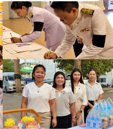
ข้าราชการ พนักงานเทศบาล ร่วมกิจกรรมเนื่องในวันคล้ายวันประสูติ สมเด็จพระเจ้าลูกยาเธอ เจ้าฟ้าทีปังกรรัศมีโชติ มหาวชิโรตตมางกูร สิริวิบูลยราชกุมาร 29 เมษายน 2569 ณ ห้องพิธีการ ชั้น 5 ศาลากลางจังหวัดประจวบคีรีขันธ์ (วันที่ 29 เมษายน 2569)