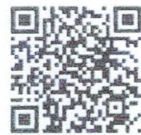
QR code ประกาศฉบับเต็ม

สิทธิเลิกสัญญาของผู้บริโภคมีดังนี้ ผู้ประกอบธุรกิจมีสถานที่พักไม่เพียงพอเมื่อเทียบกับจำนวนสมาชิก ผู้ประกอบธุรกิจจัดหาสถานที่พัก หรือจัดบริการไม่เป็นไปตามข้อความหรือโฆษณาที่ชักชวนไว้ ผู้บริโภคมีสิทธิเลิกสัญญาโดยการส่งหนังสือแสดงเจตนาไปยังผู้ประกอบธุรกิจ ภายในเวลา ๑๔ วัน นับแต่วันที่ทำสัญญา เมื่อผู้บริโภคใช้สิทธิเลิกสัญญา ให้ผู้ประกอบธุรกิจคืนเงินเต็มจำนวนที่ผู้บริโภคจ่ายไป ภายในกำหนดเวลา ๑๕ วัน นับแต่วันที่ได้รับหนังสือแสดงเจตนา ผู้ประกอบธุรกิจที่ไม่ปฏิบัติตามที่กฎหมายกำหนดจะมีโทษจำคุกไม่เกินหกเดือน หรือปรับไม่เกินหนึ่งแสนบาท หรือทั้งจำทั้งปรับ